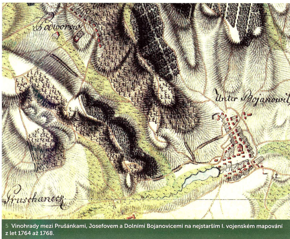
5 Vinohrady mezi Prusankami, Josefovem a Dolními Bojanovicemi na nejstarším I. vojenském mapování z let 1764 až 1768.