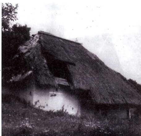
4 Vinná buda z Josefova

vím zarostl. Však též ovoce a tráva v tom žlebě mezi runou a polem, počnouc od rybníka kukvického až po hranice potvorovské, k panské ruce se bívává, a dostává se některým rokem, když se časné vytkne a pilně hledí drahné ovoce, a několik fůr toho nejpěknějšího sena pro dobytek ovčí.“ 13