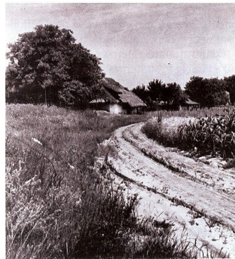
58. Josefov, okres Hodonín. Vinné bůdy.

Zajímavým údajem je i zápis o žlebu pod těmi horami mezi polem a vinohrady. Písař neopomněl poznamenat, že se tudy za starodávna honil dobytek z Kukvic na Úlehle poddvorovské. V roce 1691, kdy se již tudy dobytek nehonil, žleb „pod runou vinohradní, ze strany vinohradů, všelijakým stromo-