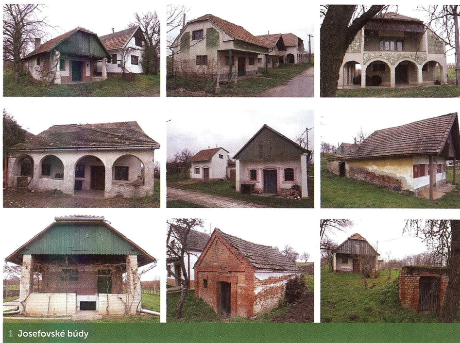
1. Josefovské budy

Také obyvatelé Mikulčic obhospodařovali kukvicke vinohrady, a to jmenovitě všichni