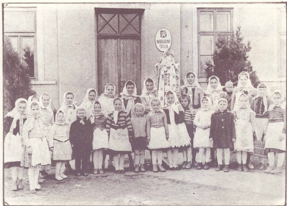
Smrtnice u místní školy v roce 1960