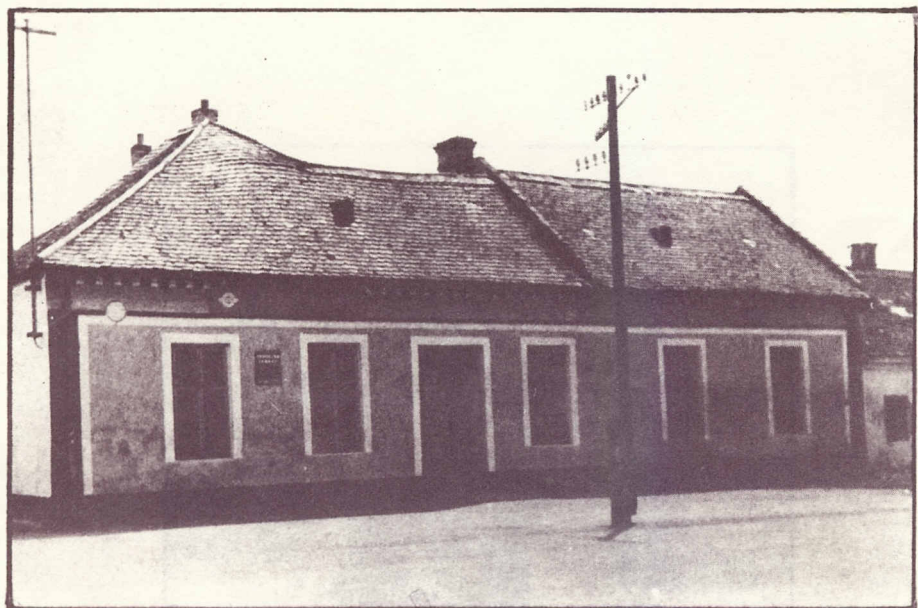
Budova místního pohostinství v roce 1970