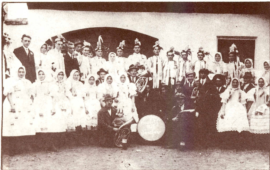
Zábava v letě u místního pohostinství v roce 1926