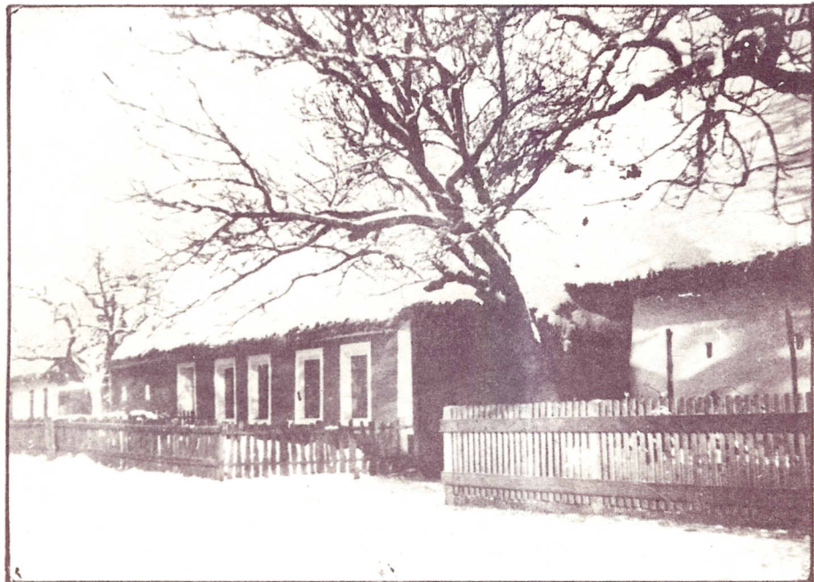
Poslední dochové domy v roce 1949