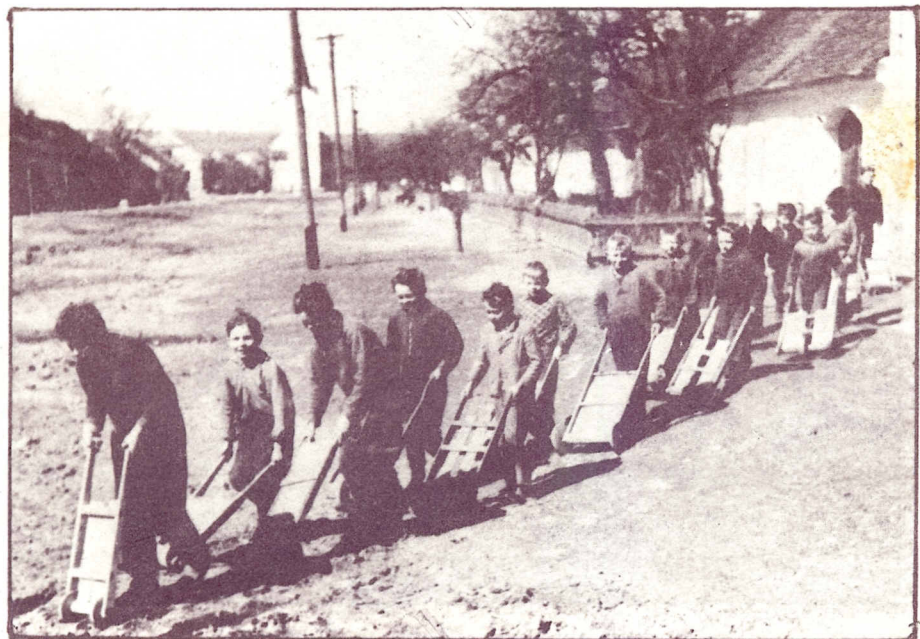
Hrkání na velikonoce v roce 1952