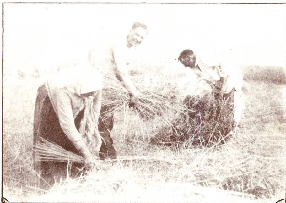
Zně roku 1930