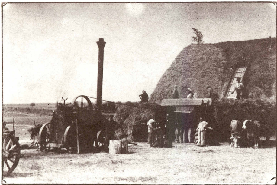
Žne roku 1920