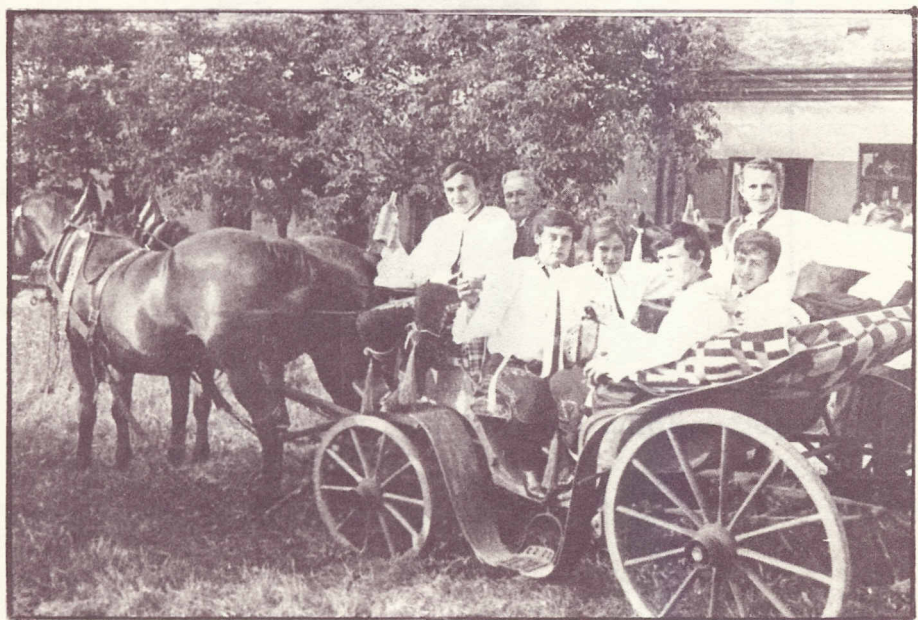
Místní chasa jede přes pole na hody v roce 1973