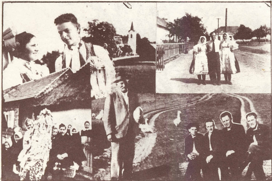
Pozdrav z Josefova roku 1940