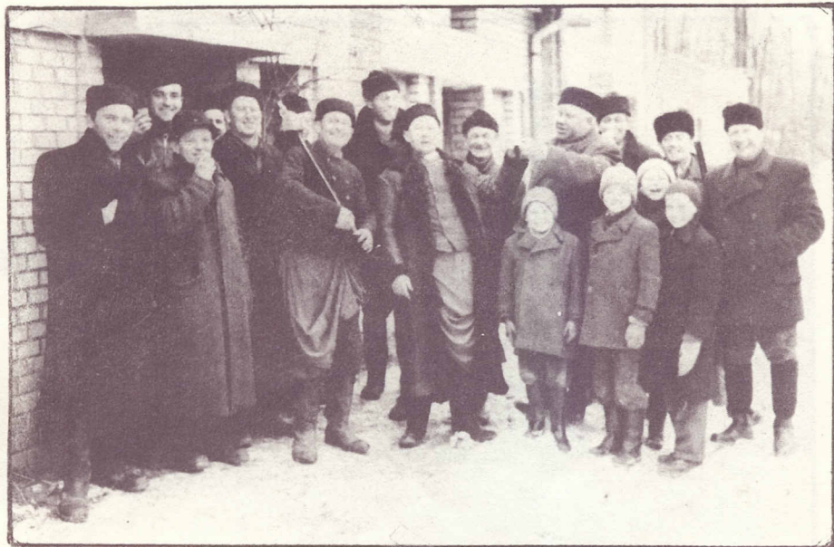
Po chytání koroptví v roce 1957