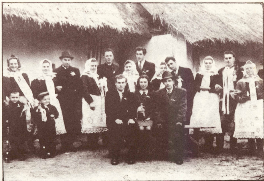
Švadba v roce 1944