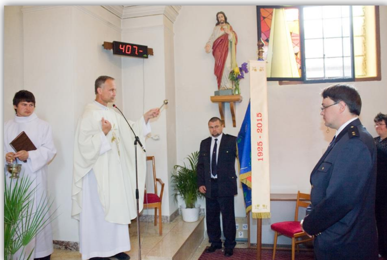
Slavnostní mše a svěcení praporu SDH Josefov