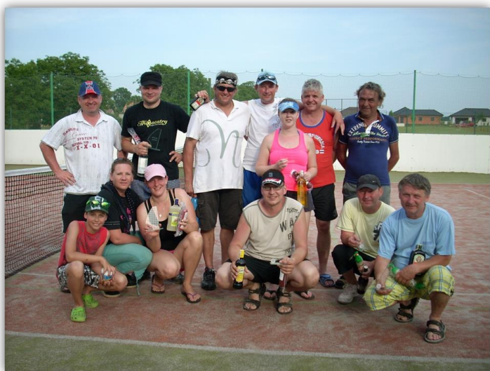
Josef II. Open