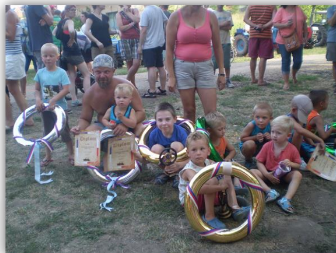
Plkač Trophy Cup 2016