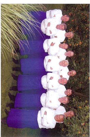
Mužáci z Kobvíl také rádi a dobře oživují autorův rukopis.